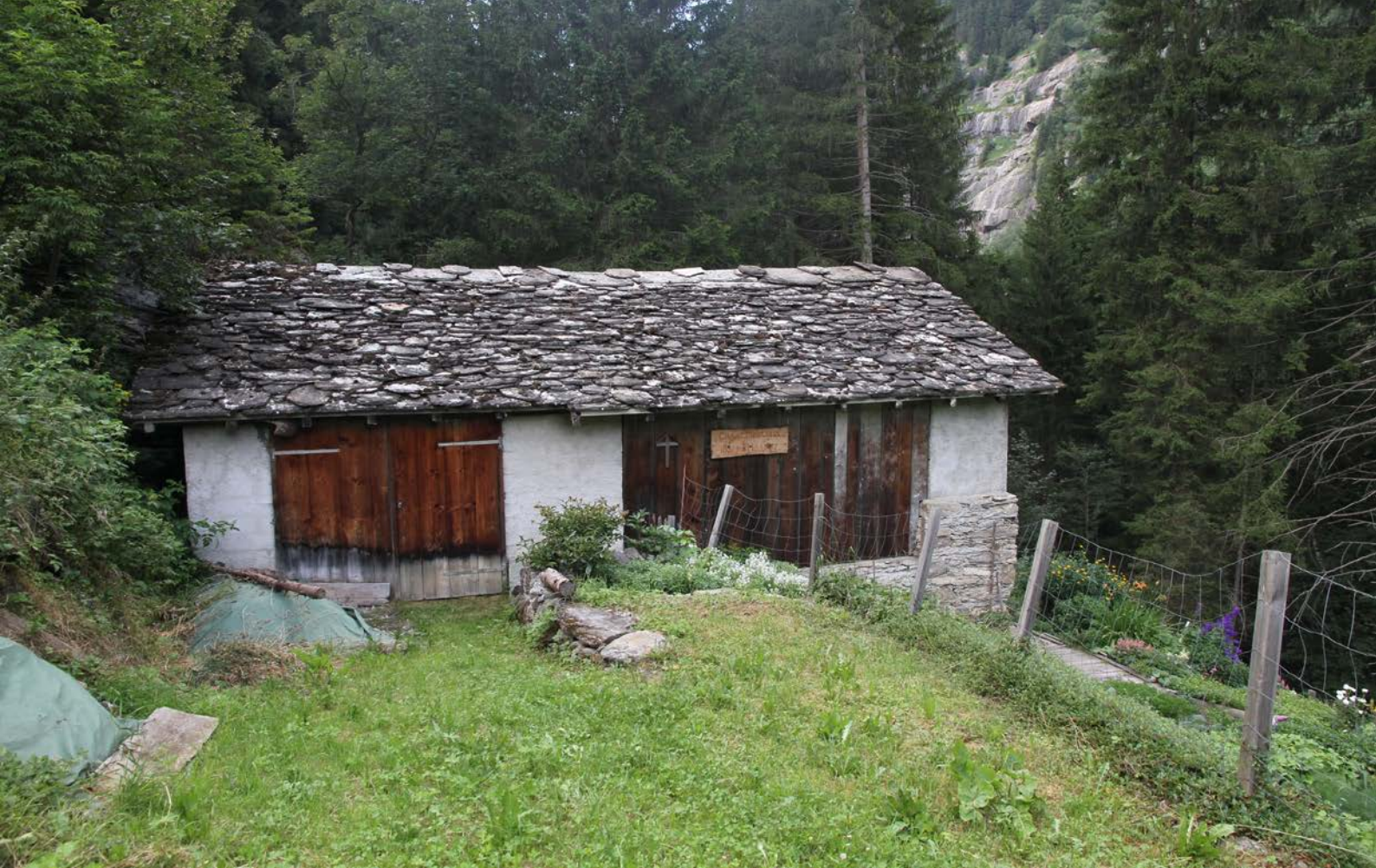
Abb. 7: Traditioneller Stall in Vals (1230m über Meer) mit Wochenstubenquartier der Kleinen Hufeisennase.