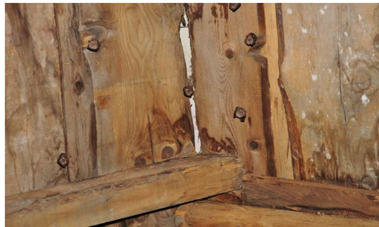
Abb. 8: Kleine Hufeisennasen der Valser Wochenstubenkolonie.