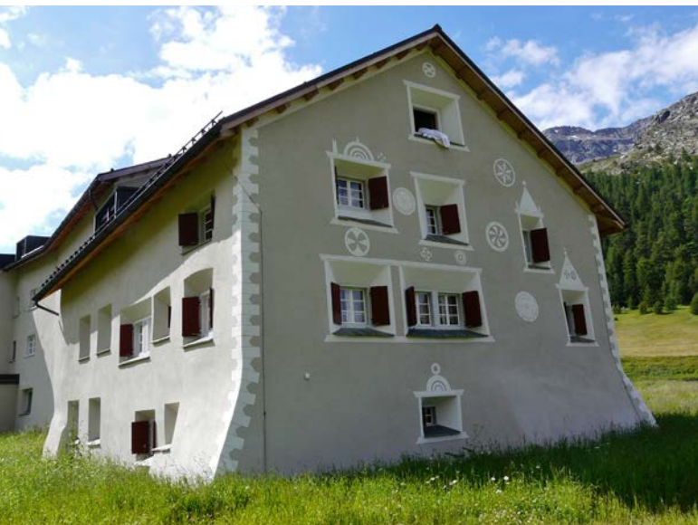
Abb. 5: Gasthaus & Hotel Berninahaus in Bernina Suot (Pontresina, 2080m über Meer) mit dem aktuell höchstgelegenen Wochenstubenquartier der Nordfledermaus in Graubünden.

hause» zurück findenden Tiere zu passen. Das Wiederauftauchen der Tiere – nach vielen Jahren der Ungewissheit – ist mit grosser Wahrscheinlichkeit auch darauf zurück zu führen, dass dank dem Verständnis der Eigentümer die Dacheindeckung des Gebäudes mit Blech im Bereich des Fledermausquartiers beibehalten werden konnte. Blechdächer werden durch Sonneneinstrahlung optimal erwärmt. Die Fledermäuse sind für die Aufzucht von Jungtieren auf ein möglichst warmes Quartier im Zwischendach in dieser Höhenlage besonders angewiesen. Am 29.6.2016 wurden immerhin wieder 66 Tiere beim abendlichen Ausflug aus dem Quartier gezählt.