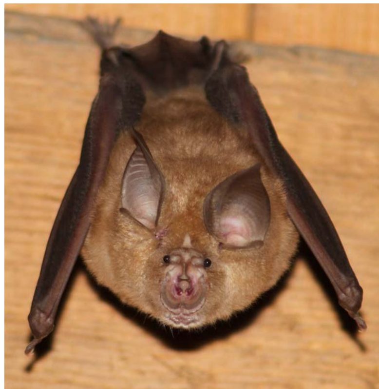
Abb. 1: Grosse Hufeisennase, erwachsenes Tier.

Die Grosse Hufeisennase gehört mit einer Flügelspannweite von 35–40 cm zu den grössten einheimischen Fledermausarten und ist zugleich die stattlichste Vertreterin der 5 Hufeisennasenarten Europas. Hufeisennasen sind an ihrer hufeisenförmigen Hautbildung um die Nasenlöcher sehr gut erkennbar