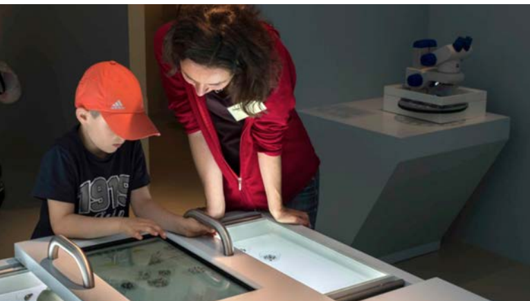
Abb. 9: In der neuen Ausstellung «Fledermaus-Welt» im Zoo Zürich gibt es für grosse und kleine Fledermausfans viel Faszinierendes zu entdecken und zu erforschen.

Das neue Informations- und Ausbildungszentrum der Stiftung Fledermausschutz im Zoo Zürich mit der sehr attraktiven Ausstellung «Fledermaus-Welt» (Abb. 9) wurde im Juni 2016 eröffnet. Die Ausstellung lädt ein zum Entdecken und Erforschen der Biologie der Fledermäuse und will das Verständnis für den Schutz der bedrohten Fledermäuse in der breiten Bevölkerung fördern. Sie ist täglich öffentlich zugänglich. Details dazu finden sich auf der Webseite der Stiftung Fledermausschutz: www.fledermausschutz.ch .