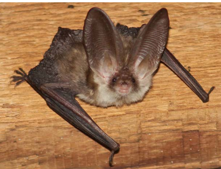
Abb. 6: Braunes Langohr.

In Graubünden verteilen sich die Langohrquartiere über die ganze Kantonsfläche und über einen Höhenbereich von 570 m bis 1920 m ü.M. Gemäss neueren Erkenntnissen kommen in unserem Kanton zwei Langohrarten vor: Das Braune Langohr ( Plecotus auritus , Abb. 6) und das Alpenlangohr ( Plecotus macrobullaris ). Wie sich diese beiden Langohrarten innerhalb von GR verteilen, wird sich im Verlauf der nächsten paar Jahre ergeben, da inzwischen mit genetischen Analysen von Langohr-Kotpro-