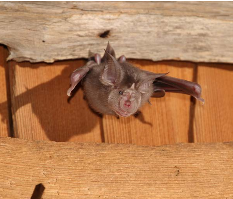
Abb. 2: Grosse Hufeisennase, Jungtier.

Die Grosse Hufeisennase ist eine dachstockbewohnende Fledermausart. Nur warme und störungsfreie Quartiere sind für die Jungenaufzucht geeignet. Erst Ende Juni, anfangs Juli werden darin die Jungtiere geboren. Die Weibchen der Grossen Hufeisennase bringen wie die meisten einheimischen Fledermausarten nur ein Jungtier (Abb. 2) zur Welt und dies nicht jedes Jahr.