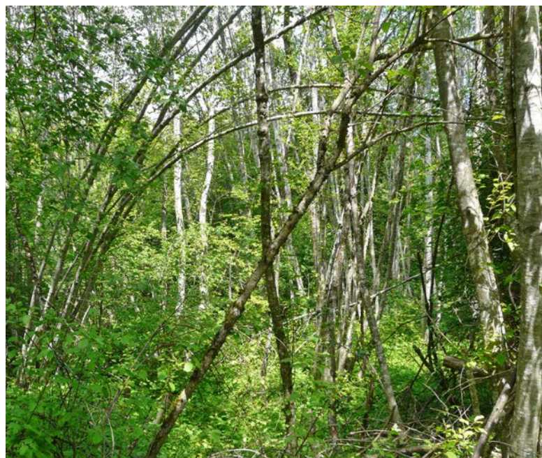
Abb. 3: Jagdgebiet der Grossen Hufeisennasen in den Vorderrheinauen bei Castrisch.

niken. Sie jagt zwischen den Bäumen von lichten Wäldern oder von Obstgärten in ununterbrochenem Flug. An Wald- und Heckenrändern hingegen kann sie bei der für diese Fledermausart besonders charakteristischen «Wartenjagd» beobachtet werden. Die Grosse Hufeisennase hängt dabei an einem Baum oder Strauch am Waldrand oder im lichten Laubwald, ein bis zwei Meter über dem Boden. Den Körper unablässig um die eigene Körperachse drehend, ortet sie in der Nähe vorbei schwirrende Insekten. Hat sie ein Beutetier entdeckt, fliegt sie meist nur wenige Sekunden von ihrer Warte weg, versucht das Insekt zu erhaschen und kehrt danach wieder zur Warte zurück. Dort frisst sie das erbeutete Insekt, nachdem sie es mit Hilfe ihrer kleinen, spitzen Zähne von den unverdaubaren Flügeln und Beinen befreit hat, oder sie wartet auf ein nächstes Beutetier. Typisch für die Wartenjagd ist, dass die kurzen Flugphasen nur einen kleinen Teil der gesamten Jagdzeit ausmachen und die Tiere mehrheitlich hängen. Möglicherweise wendet die Grosse Hufeisennase diese Energie sparende Jagdtechnik vor allem bei geringer Fluginsektenichte oder bei Vorkommen von besonders «ergiebigen» grossen Beutetieren an. Kotanalysen haben gezeigt, dass Käfer, Falter, Hautflügler und Zweiflügler die Nahrungsgrundlage der Grossen Hufeisennase bilden, wobei vor allem mittlere und grosse Insekten gefressen werden. Grosse Hufeisennasen können daher als Nahrungsspezialisten bezeichnet werden.